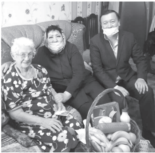
өзіндік орны бар. Оның ерекшелігі Ұлы Отан соғысы жеңісіне 75 жыл толуына орай Халық қаһарманы, Кеңес Одағының батыры, Армия генералы С.Нұрмағамбетов атындағы

Болашақ ұрпақтың амандығы үшін толарсақтан қан кешіп жүріп елге бейбіт күн сыйлаған майдангерлер қазіргі таңда саусақпен санарлық. Олардың ерлігінің даңқы ешқашан өшпек емес, себебі ерлікті үлгі етер ұрпақтары бар, ерлікті дәріптер елі бар.